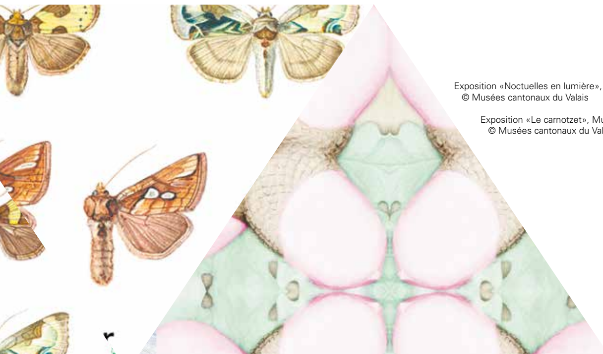
Exposition «Noctuelles en lumière», Le Pénitencier, Sion, © Musées cantonaux du Valais

La collection s'est enrichie de blocs de roches exceptionnelles de la région de Täsch-Zermatt. Deux campagnes de repérage en haute montagne, puis un transport par hélicoptère ont permis d'identifier, de prélever puis d'apporter au Musée de la nature plusieurs blocs de laves en coussins fossiles en faciès éclogitiques.