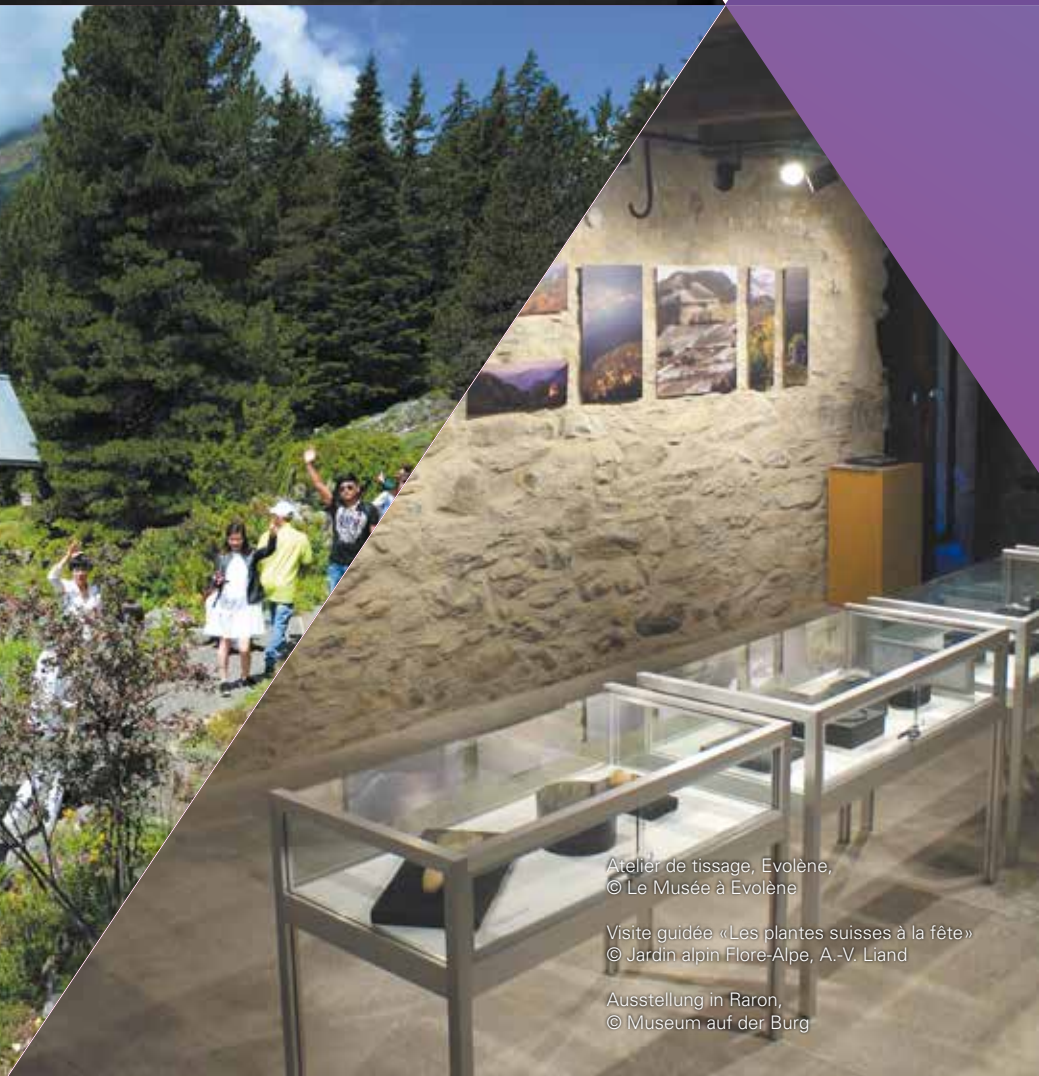
Atelier de tissage, Evolène