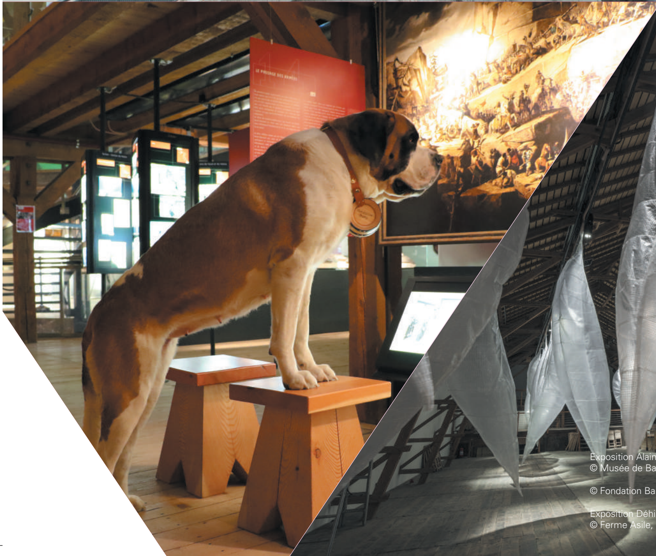
Exposition Alain Bublex, © Musée de Bagnes, Bonardot 2016