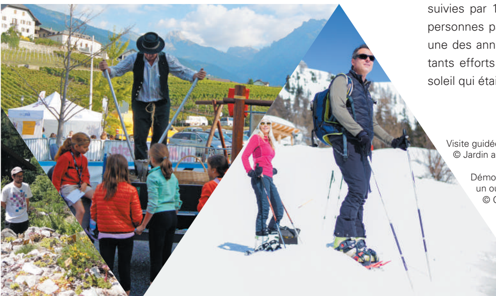
Visite guidée «Les plantes suisses à la fête», © Jardin alpin Flore-Alpe, A.-V. Liand

Pour conclure, les visites guidées de l'Ecomusée ont été suivies par 1327 participants et la moyenne était de 13 personnes par visite. L'année 2016 restera certainement une des années record pour Colombire grâce aux importants efforts fournis par les collectivités publiques et au soleil qui était généreusement présent tout l'été 2016!