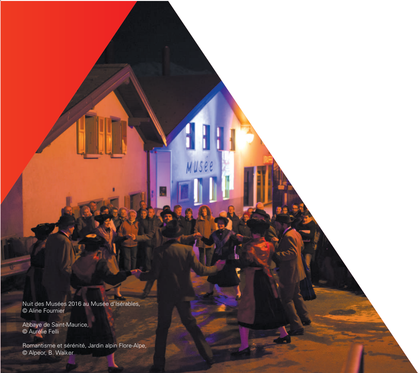
Nuit des Musées 2016 au Musée d'Iséables, © Aline Fournier