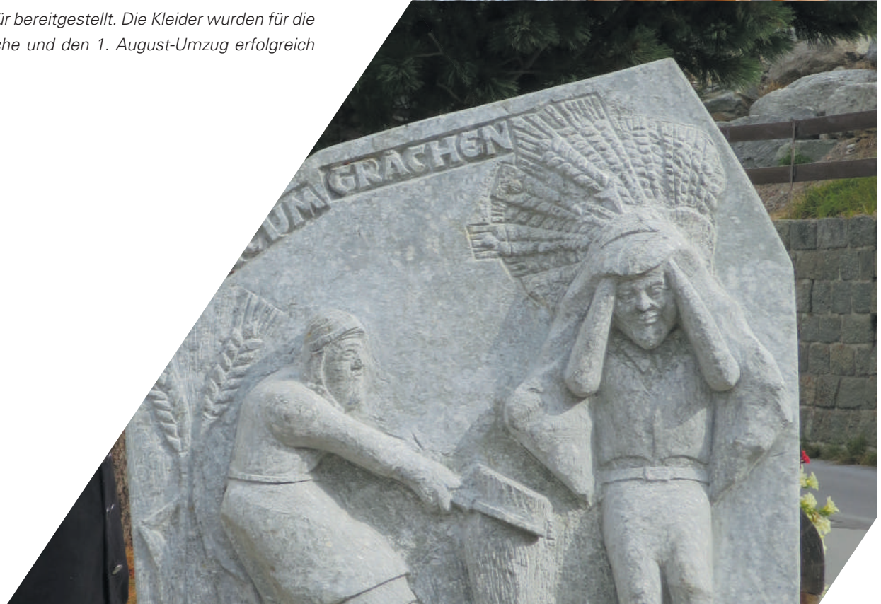
Bergführer Museum in St-Niklaus, © Vereinigung der Walliser Museen, E. Genolet Skulptur von Ewald Brigger, Grächen, © J. Colijn