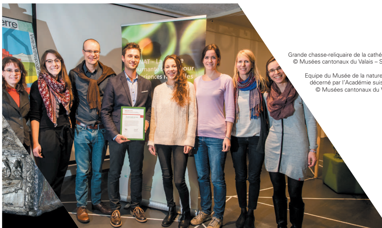
Grande chasse-reliquaire de la cathédrale de Sion (XI e siècle)

Enfin le Musée de la nature a poursuivi sa mission de direction du Jardin botanique alpin de Champex: l'organisation du personnel et le mode de gestion du site ont été revus.