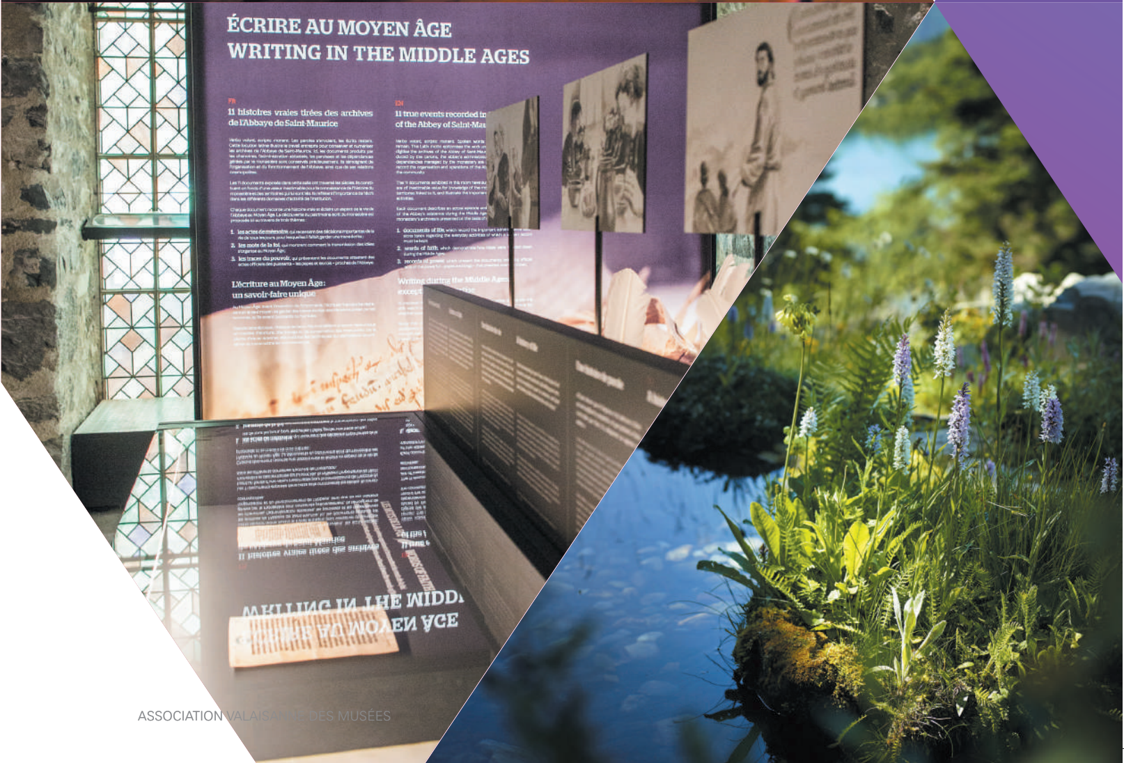
Romantisme et sérénité, Jardin alpin Flore-Alpe, © Alpeor, B. Walker